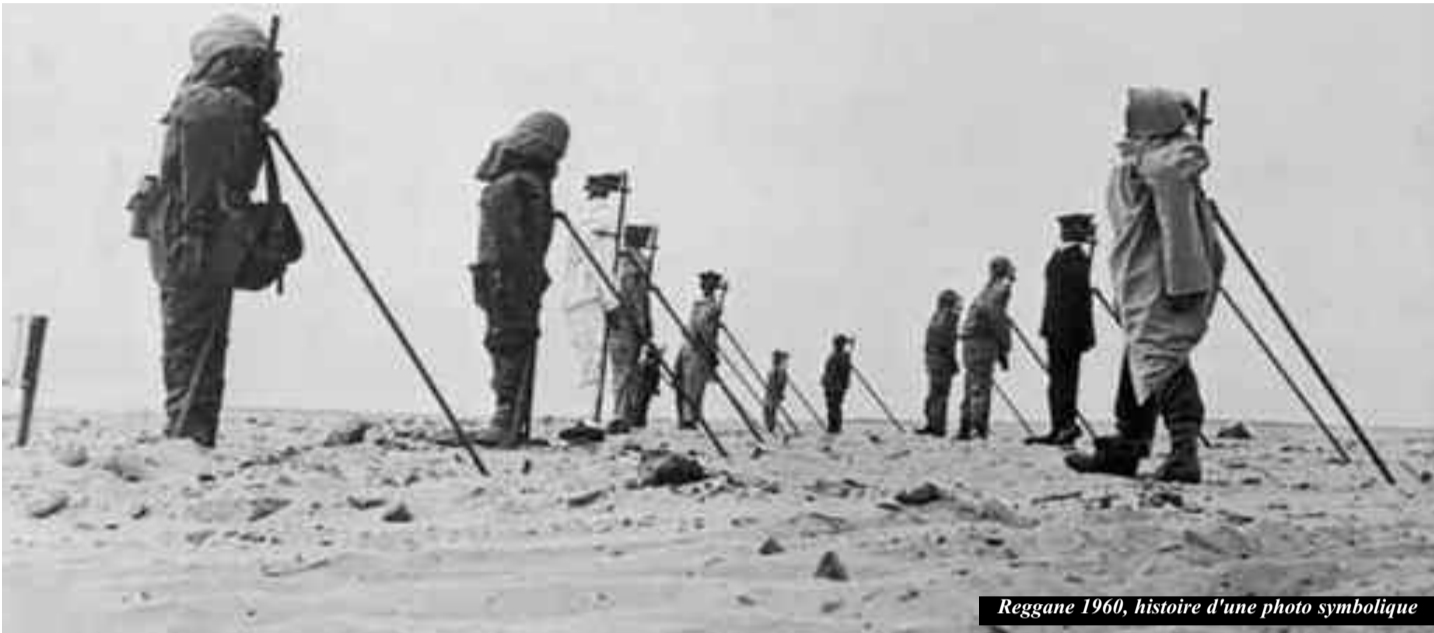
Reggane 1960, histoire d'une photo symbolique

Mis dos au mur, le président français a été interpellé par neuf députés français qui ont réclamé, dans une lettre qui lui a été adressée et publiée par le « Journal Du Dimanche » (le JDD), la publication des « données et les cartes des zones » des déchets nucléaires enterrés en Algérie.